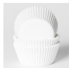
House of Marie Baking Cups Wit pk/48