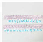
FMM Tappit Uitsteker Alfabet Kleine Letters