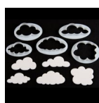
FMM Uitsteker Wolken