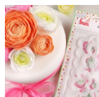
FMM Uitsteker The Easiest Ranunculus Ever