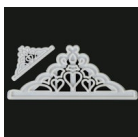
FMM Uitsteker Tiara