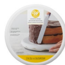
Wilton Basic Draaitafel voor Taarten