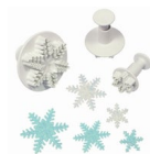
PME Plunger Uitsteker Sneeuwvlok set/3