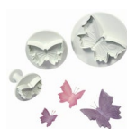
PME Plunger Uitsteker Vlinder set/3