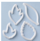
FMM Uitsteker Blad