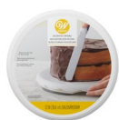
Wilton Basic Draaitafel voor Taarten