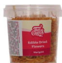
FunCakes Eetbare Gedroogde Bloemen Goudsbloem 5g