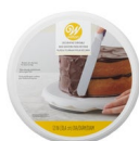
Wilton Basic Draaitafel voor Taarten