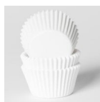
House of Marie Mini Baking Cups Wit pk/60