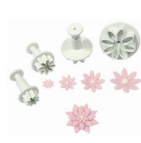
PME Plunger Uitsteker Madelief/Margriet set/4