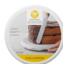
Wilton Basic Draaitafel voor Taarten