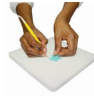
PME Flower Foam Pad